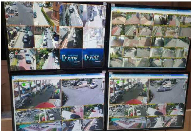
관제 프로그램 작동화면