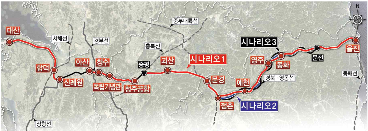
< 구간별 노선계획 >