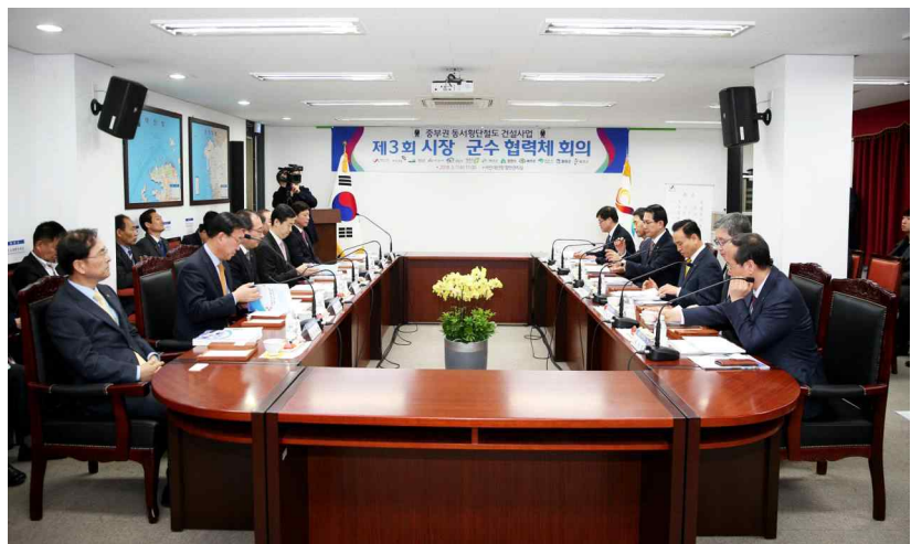
< 제3회 시장·군수 협력체 회의 >