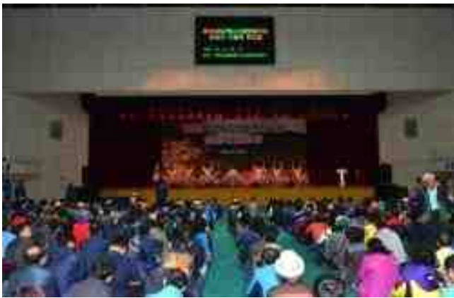
2016 경상북도 산림문화축제