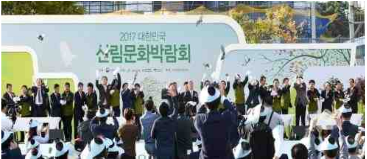
2017 대한민국 산림문화박람회