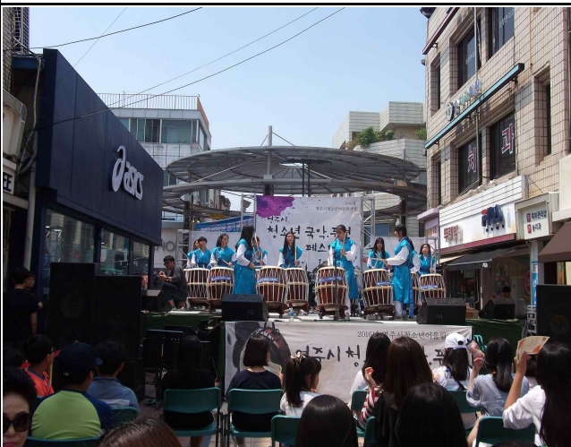
2016년 국악 페스티벌 개최(2016.06.18)