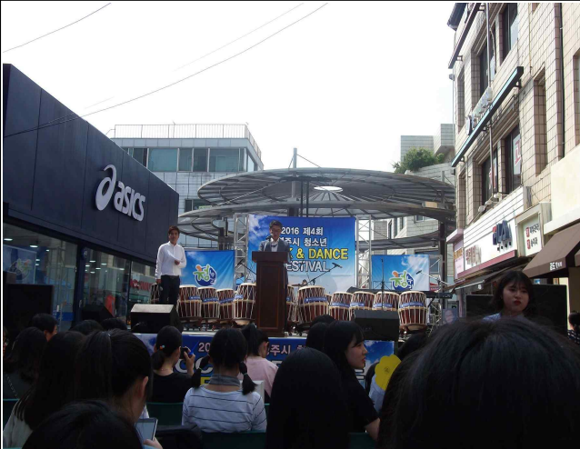
2016년 청소년 락앤댄스 페스티벌 개최(2016.05.21)