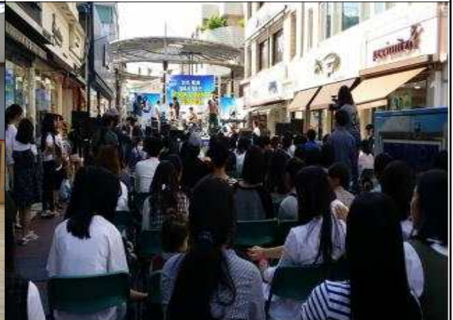
2015년 청소년 락앤댄스 페스티벌 개최