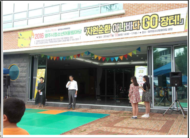
청소년문화의집 아나바다 GO 장터(2016.09.10)