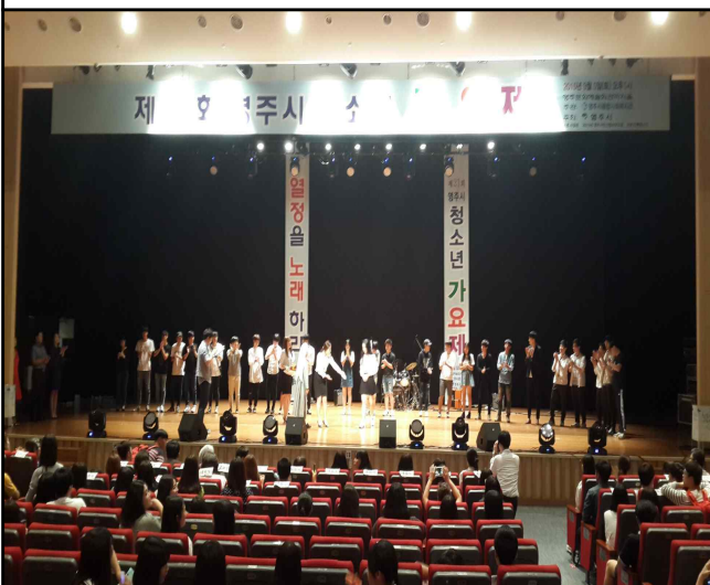
영주시 청소년 가요제(2015.09.05)