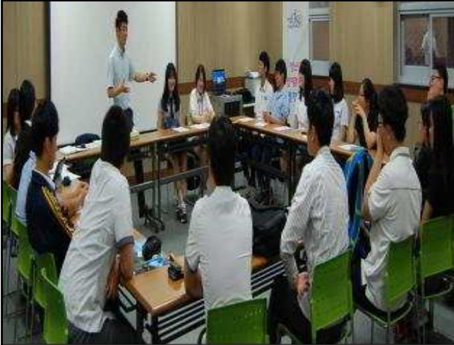
청소년상담복지센터 참여위원회 회의