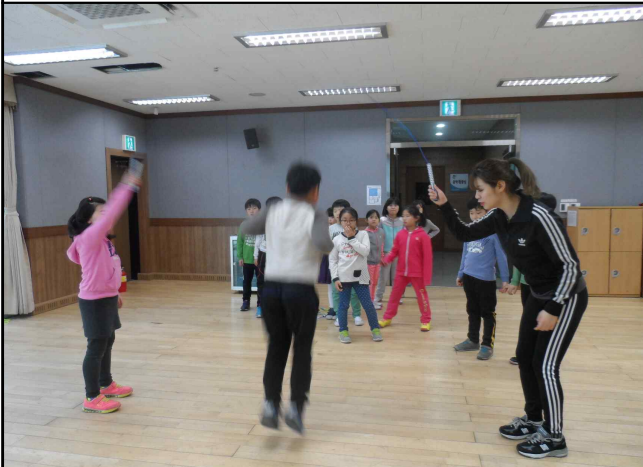
청소년문화의집 문화·체육 프로그램 운영