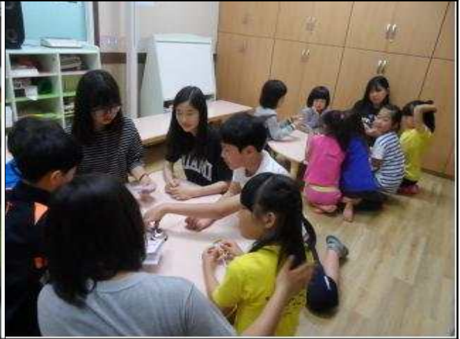
청소년문화의집 청소년봉사단 활동