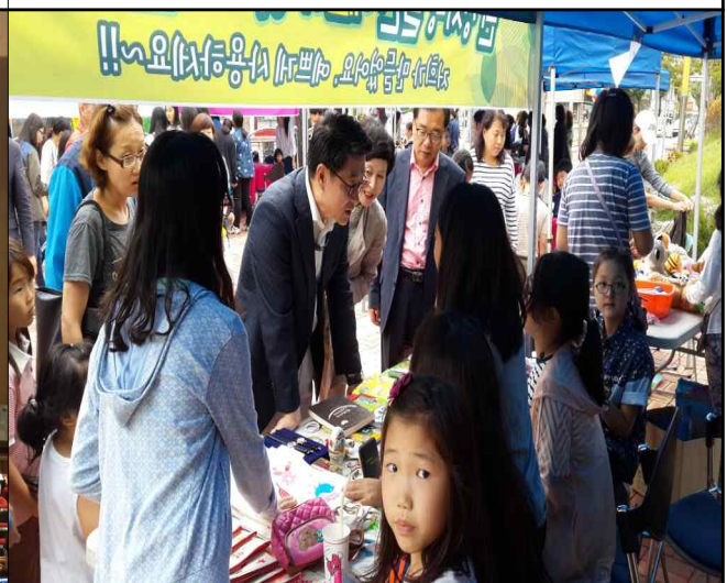
청소년문화의집 아나바다 GO 장터(20150912)