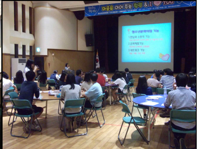
2016년 청소년 자차기구 워크숍(2016.05.28~05.29)