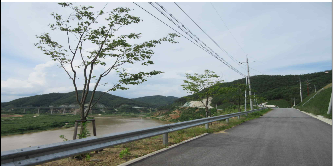
영주댐 주변 부체도로(2016년 벚꽃길 조성지)